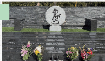
「偲風～しのぶ～」110,000円(税込)