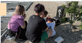
1匹 100円(税込)線香・火葬 対象年齢:高校生まで。