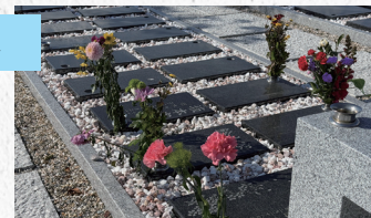
「偲風～しのぶ～」 110,000円(税込)