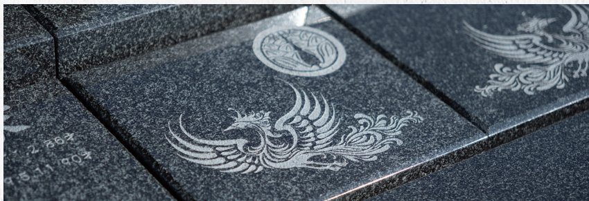
「花奏 ～かなで～」 330,000円 (税込)